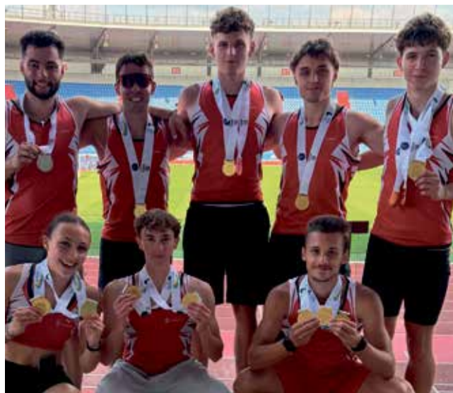
Atletům AK Olomouc se na mistrovství Moravy a Slezska velmi dařilo.