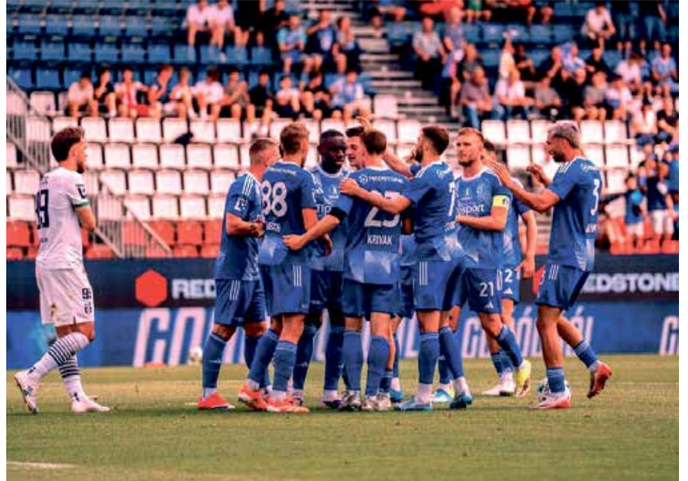
Fotbalisté SK Sigma Olomouc zakončili soutěžní ročník Chance Ligy jasnou domácí výhrou.