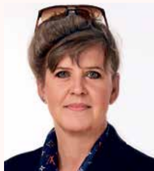
Miroslava Ferancová primátorka

Ptejte se vedení města Olomouce na e-mailové adrese otevrenaradnice@hanackyvecernik.cz a my Váš dotaz necháme zodpovědět!