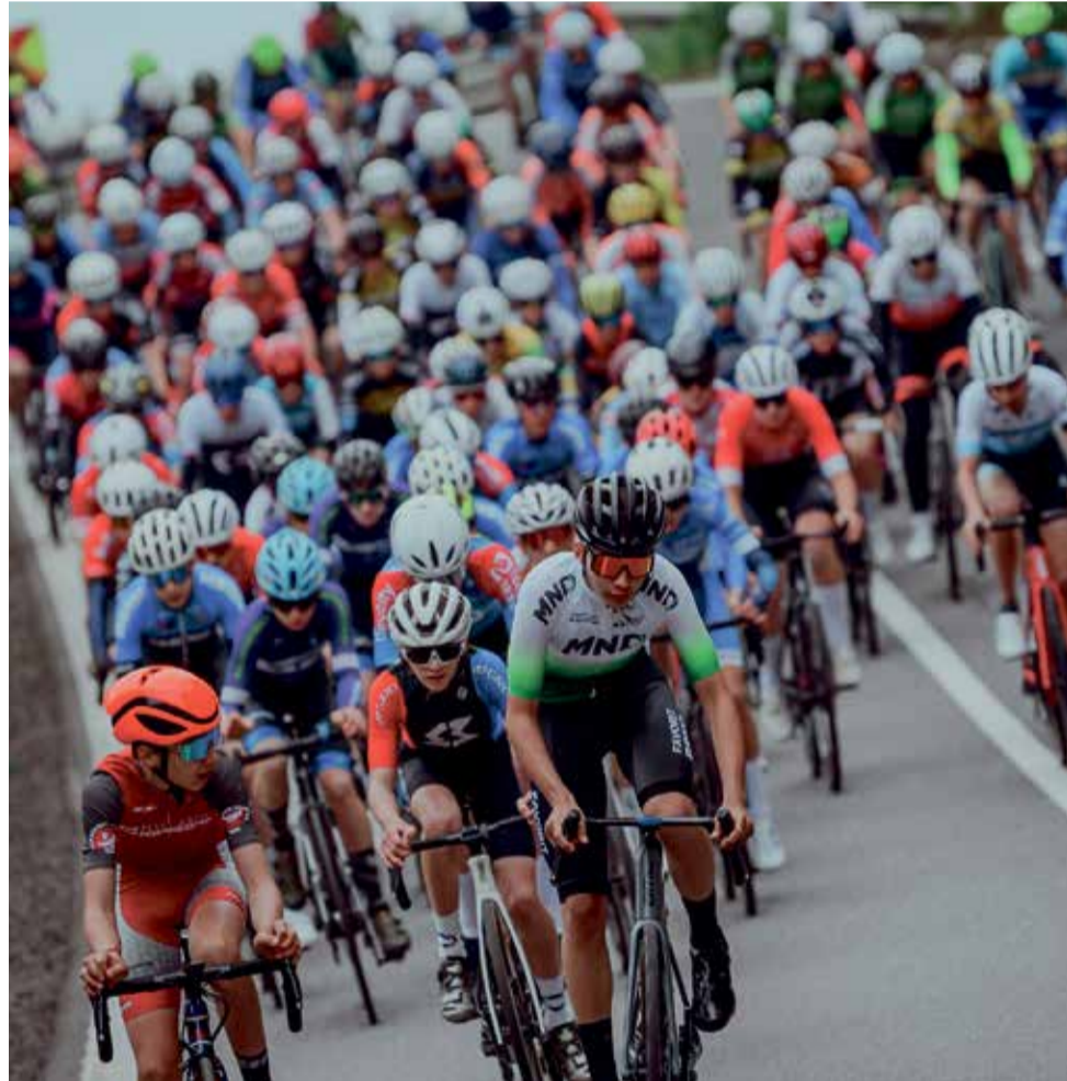
Cyklisté pojedou o tituly na silnicích v Olomouckém kraji.

Organizátoři budou v následujících týdnech postupně zveřejňovat další informace. ■ pel