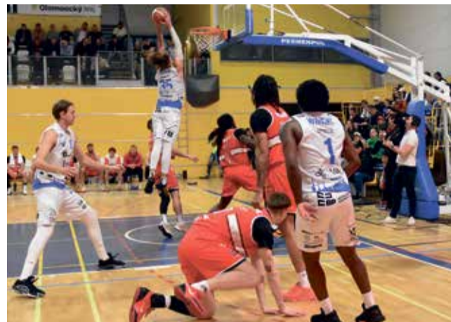
Basketbalisté BK Olomoucko se probíjeli do čtvrtfinále play-off.

z pohledu bojovnosti. Střelecky se nám ale nedařilo ve třetí čtvrtině ani na začátku té poslední. To nás stalo zápas i postup. Narazili jsme na soupeře, který měl dobrou sezonu, nakonec rozhodly individuality v domácím týmu,“ řekl Jan Šotnar, trenér BK KVIS Pardubice. ■