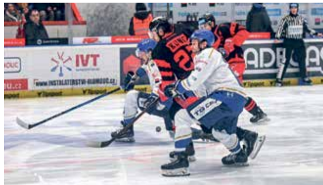
Hokejisté HC Olomouc budou hrát celou baráž o udržení v extralize doma.

„Rozhodnutí a celý proces s ním spojený nebyl jednoduchý. Nastavené podmínky pro postup do extraligy jsou dány a z těch musíme vycházet. To znamená, že baráž už nemůžeme hrát ani v našem druhém domově, to říkám cíleně, jelikož po třetí sezoně působení v azylu v Pelhřimově nás místní začali vnímat jako jejich klub a vytvořili spolu s našimi jihlavskými skvělou atmosféru, ani na jiném stadionu v Kraji Vysočina. Žádný stadion u nás v kraji licenčními podmínkami neprojde. I v budoucnu to bude jen a pouze aréna v Jihlavě, která splní podmínky. Ani fanoušky tolik zmiňo-