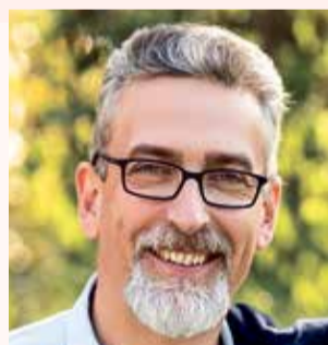
Mirek Žbánek primátor

Ptejte se vedení města Olomouce na e-mailové adrese otvorenaradnice@hanackyvecernik.cz a my Váš dotaz necháme zodpovědět!